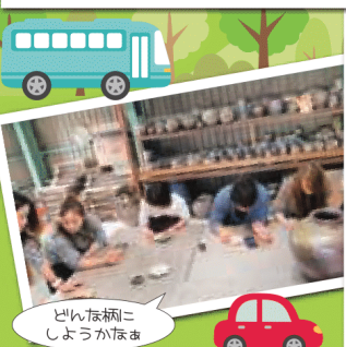
どんな柄にしようかな