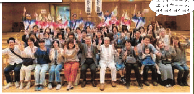
エライヤッキヤ、エライヤッキヤ、ヨイヨイヨイヨイ