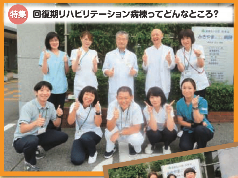
特集 回復期リハビリテーション病棟ってどんなところ？